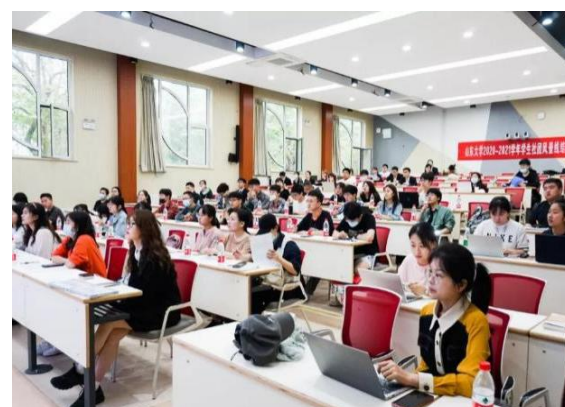
图 9 社团风景线结项答辩会