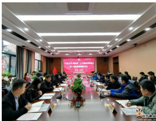
图 14 山东大学-钢铁侠人工智能与机器人 双一流实验室