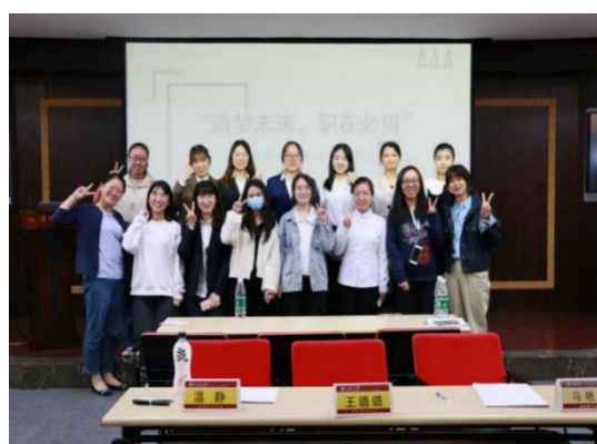
图 12 团支部“我为青年办实事”活动

为保障工作覆盖面，我校共青团一方面充分发挥团组织优势，面向全校团员先后开展团支部党史学习教育和“支部有温度—我为青年办实事”活动，各支部累计开展学习类活动1800余次，办实事类活动1500余次；另一方面立足团属宣传阵地，积极创新宣传形式，通过发掘发生在身边的山大故事，走进山大人的鲜活事迹，先后推出“青年园”线上团刊、“山大有诗”有声栏目、“建党百年 立校百廿”里的山大故事系列视频、“学习党史”等内容有趣、形式新颖的党史融媒体作品。为激发团员学习热情，我校共青团一方面以学生社团、学生会和研究生会等学生组织为主体，开展集体观影、擂台挑战、辩论赛、脱口秀、云宣讲等活动；另一方面将党史学习教育与社会实践与创新创业相结合，以赛促学、以学促践。