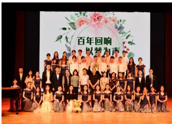
图 11 “百年回响，以梦为声”合唱音乐会