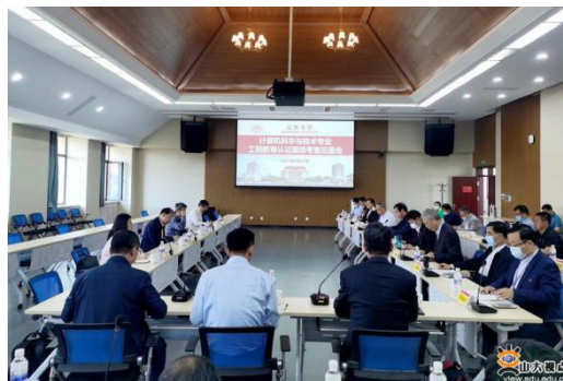
图 7 计算机科学与技术专业认证现场