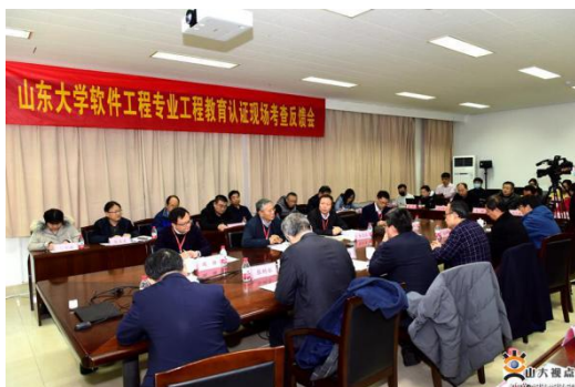
图 6 软件工程专业认证现场