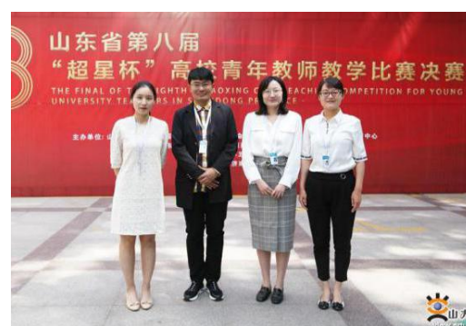
图 2 “超星杯”