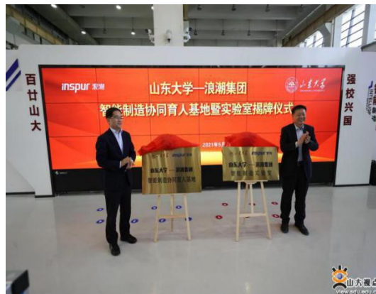
图 15 山东大学-浪潮集团智能制造协同育 人基地