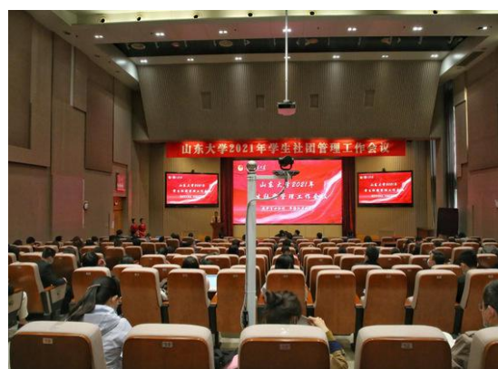
图 8 社团管理工作会议

山东大学坚持五育并举主旋律，开拓学生社团发展新格局。截至目前，我校现有二百余个学生社团，涵盖理论学习类、体育类、公益服务类、文艺类、应用实践类、职业发展类、传统文化类、学术科技类等七大类。校团委全力打造了“社团文化节”“社团风景线”“百团大战”“社团总动员”等一系列社团品牌活动；建立体育社团联盟、公益社团联盟等各类学生社团联盟，加强社团交流沟通，专项扶持社团发展。