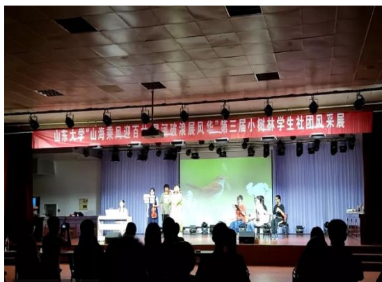
图 10 小树林学生社团风采展