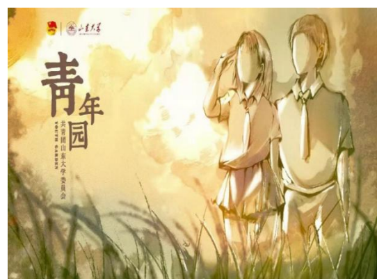
图 13 《青年园》线上团刊复刊