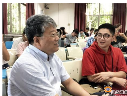
图 5 校领导开学第一周参加“公开课”教学听课活动

校领导听课形成制度化。除每学期开学初领导进课堂检查教学秩序和教学准备情况，参加教学公开课活动外，校领导还在整个学期过程中不断走进课堂，指导教师改善授课方式，提高授课质量。