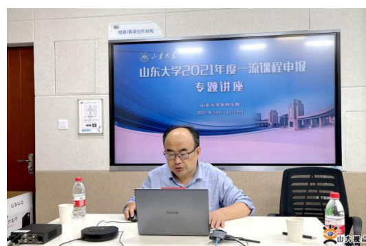
图 1 一流课程申报讲座

稳步推进疫情期间教师国际化建设。在疫情防控常态化背景下，加强与海外友好高校的联系，探索多方式交流合作模式，做好教师公派出国项目管理与服务，提升公派出国工作治理服务能力。